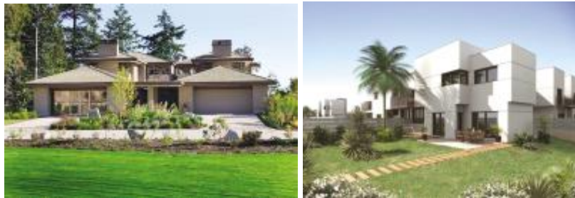
Imagen 2: viviendas tipo, grupo AB

La Dehesa, Los Domínicos, Sta. María Manquehue, Álvaro Casanova, Isidora Goyenechea, Lo Curro.